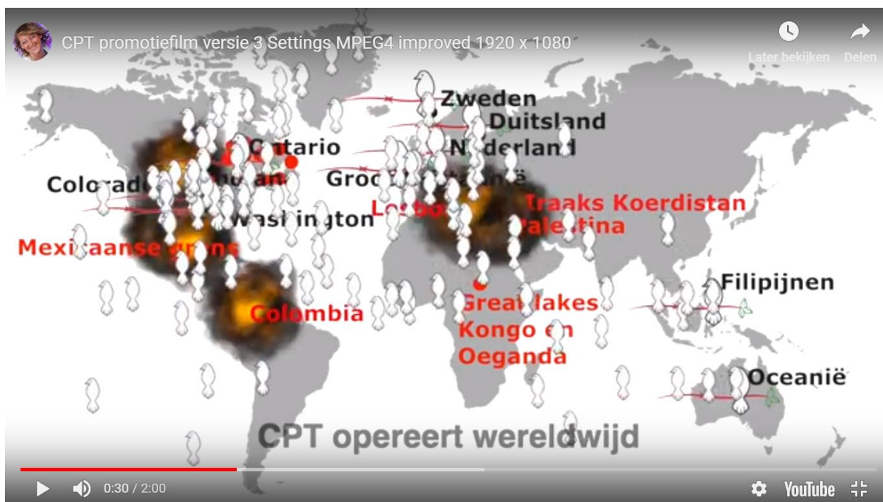
Screenshot uit promotiefilm over het werk van CPT